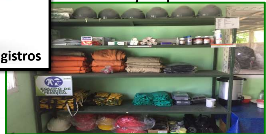
Orden y Limpieza