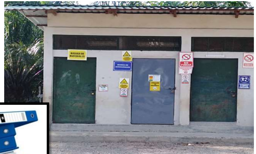
Construcción y mejoras en almacenes