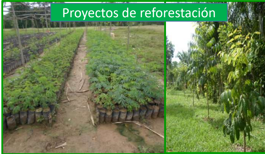
Proyectos de reforestación