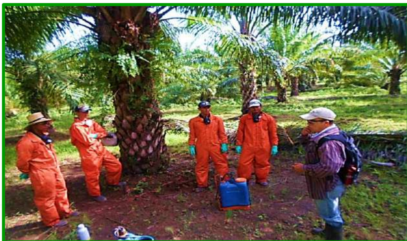
Uso y Manejo de agroquímicos