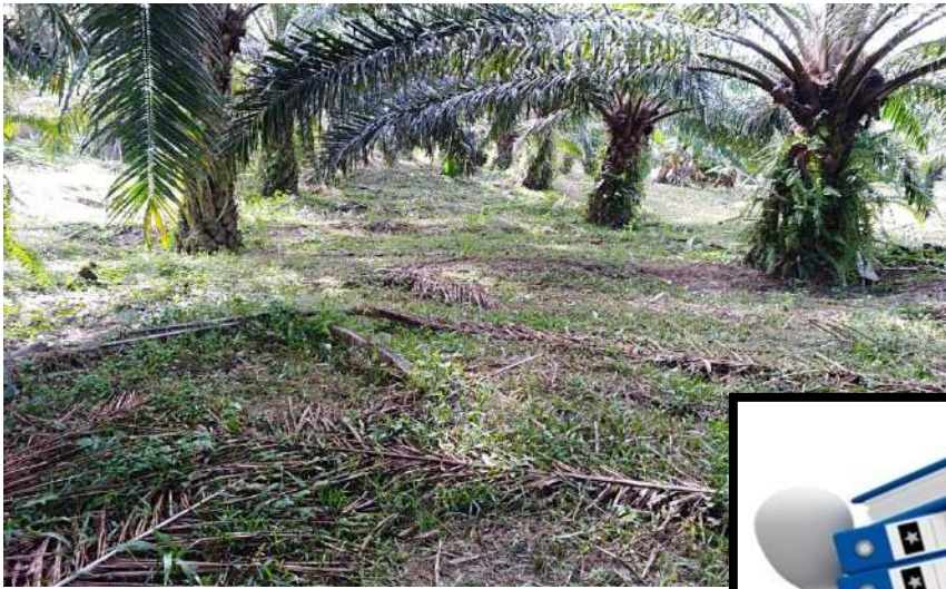
Reciclaje de Nutrientes