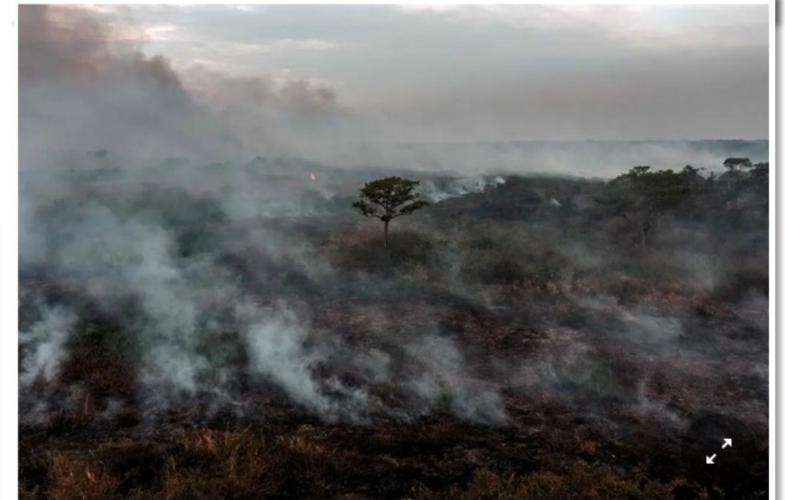
A forest fire burning in the Pantanal, Mato Grosso state, Brazil, last year.

Brazil had the largest share of tree loss last year, followed by the Democratic Republic of Congo and Bolivia. Indonesia showed improvement.